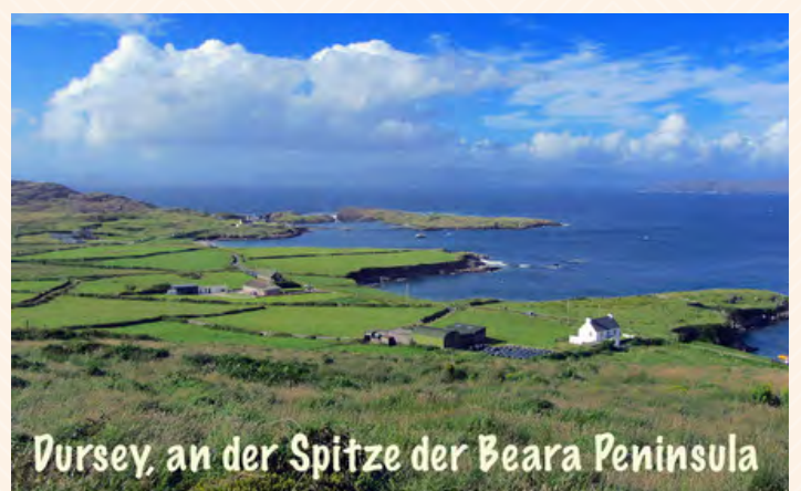
Dursey, an der Spitze der Beara Peninsula