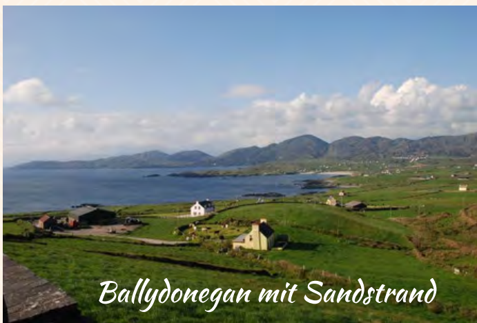
Ballydonegan mit Sandstrand

Zahlreiche Steinkreise und andere prähistorische Plätze sind in 15 bis 60 Minuten erreichbar, zum Ring of Beara sind es 10 Minuten, zum Ring of Kerry sind es 25 Minuten.