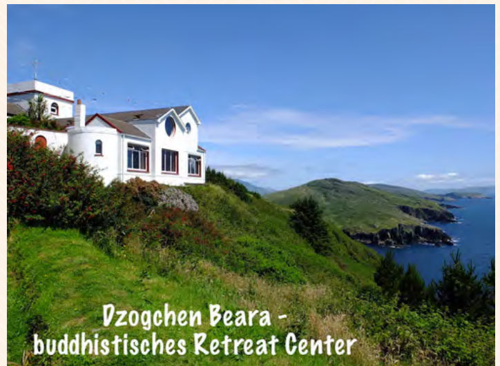
Dzogchen Beara - buddhistisches Retreat Center